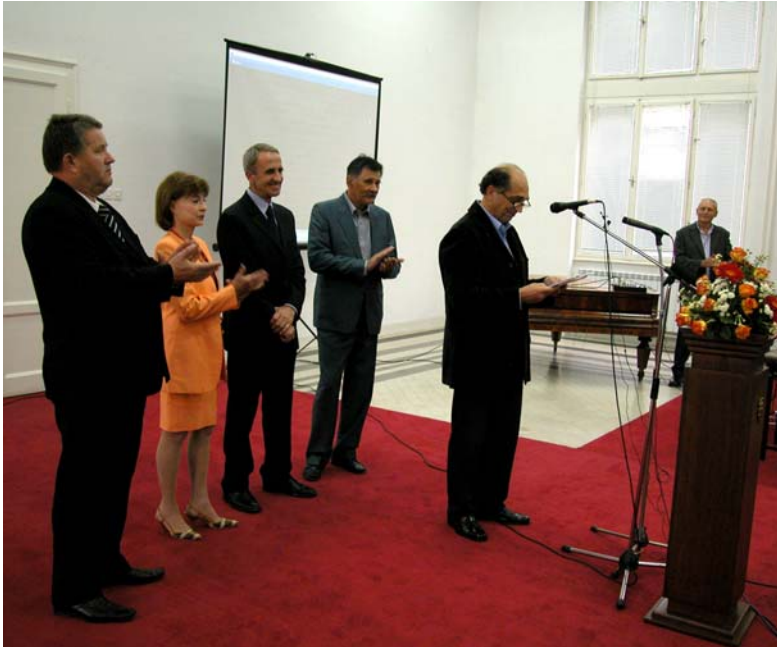
Министар културе Републике Србије Војислав Брајовић отвара изложбу