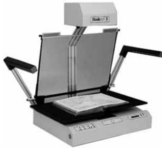
BookEye 3 A1 Color – скенер који је коришћен за скенирање фото-албума

Вишемесечни процес скенирања фото-албума завршен је крајем септембра 2014, чиме је и ова јединствена фотографска колекција од преко 2600 фото-албума у потпуности дигитализована. Због специфичних карактеристика и димензија, фото-албуми су скенирани на BookEye скенеру за скенирање књига и фотографија до А1 формата. Заснован на концепту снимања одозго уз ласерско подешавање оштрине, а у комбинацији са моторизованим држачем за књиге, интегрисаном стакленом плочом и LED осветљењем, наведени тип скенера у потпуности је уклонио сваку могућност оштећења фото-албума приликом њиховог скенирања, обезбедио максималан ниво скенираног подручја и врхунски квалитет дигиталних копија. 16