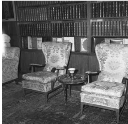
Део просторије у Резиденцији у Ужичкој 15, у којој су албуми са фототеком били изложени као део амбијенталне целине

Музеј добио 1962. године, тако да су сви остали расположиви, тавански, сутеренски и простори који су могли бити одвојени од изложбених искоришћени и уз мање адаптације претворени у депое. 5 Према сведочењу запослених, збирка фото-албума била је смештена на тавану Резиденције, који је претворен у неку врсту прихватног депоа, где су били смештени заједно са бројним предметима из других збирки. Отварањем председничке резиденције у Ужичкој 15 за посетиоце један репрезентативни део фото-албума био је изложен заједно са фототеком као део амбијенталне целине у соби поред личне библиотеке председника Тита. Поред низа објеката везаних за живот и рад Јосипа Броза Тита, Меморијални центар обухватао је и летњу резиденцију на острву Ванги на Брионима, као и Музеј „25. мај“, два објекта значајна за нашу тему управо зато што су се у њима чували остали фото-албуми који су после 1982. године прикључени збирци фото-албума. 6