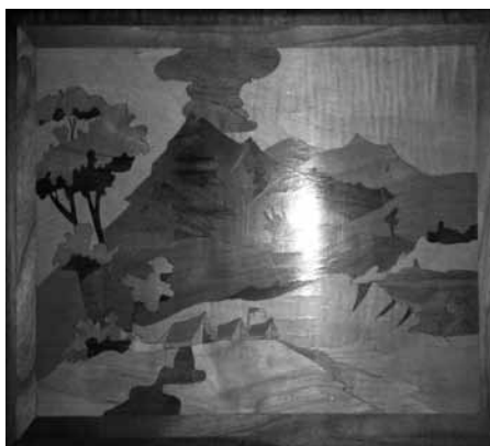
Албум са дрвеним корицама

Фотографије у албумима већином су црно-беле уз мањи број фотографија у колору и оне су на неколико начина смештене унутар корица албума. Део фотографија је својом полеђином залепљен на директну површину картонских листова албума, али има и примера где су фотографије смештене унутар специјално израђених целофанских фолија, које их на тај начин причвршћују и штите. Треба напоменути да је та фолија код знатног броја албума у мањој или већој мери поцепана, док је код неких албума она делимично или у потпуности слепљена са фотографијама. Због начина смештаја фотографија унутар албума као и честих промена услова смештаја и чувања, није редак случај оштећења како самих фотографија, тако и целокупних фото-албума. Најчешћи видови