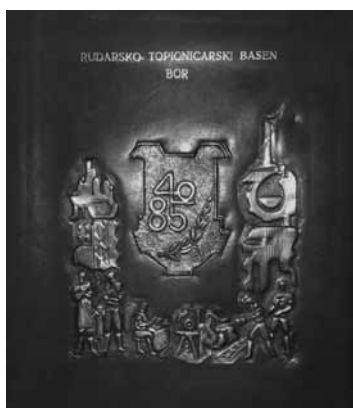
Албум са кожним корицама

Велики број разноврсних дародаваца и прилика, као и различити тренуци поклањања фото-албума условили су њихову разноврсност у погледу димензија, облика, материјала, као и самих визуелних карактеристика. Распон димензија албума креће се од 16 x 18 цм, као најмањих, до 71 x 51 цм, које спадају међу највеће. Кожа представља један од најчешће коришћених материјала за корицење фото-албума, док су остали обложени платненим, плишаним, пластичним, сомотским, дрвеним, картонским корицама, а понеки чак и мермерним плочама које имају улогу причвршћивача листова. Корице албума су најчешће декоративно украшене амблемима, металним апликацијама, грбовима, бакрописима, рељефним представама и цртежима, геометријским шарима, текстилним уметцима народне радиности, као и натписима и посветама упућени председнику Јосипу Брозу Титу, што их чини још вреднијим и занимљивијим сведочанством и историјским извором.