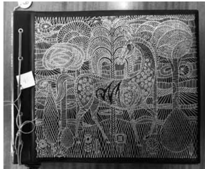
Албум у кожном корицама украшен бакарним апликацијама украшен интарзијом са украсним шарама у златотиску

оштећења фотографија јесу: блажа деформисаност, искривљеност, савијеност, избледелост, појава флека и мрља. Међу најчешћим и најблажим оштећењима албума појављују се благи деформитети страница и корица албума и мања механичка и физичка оштећења, као што су огреботине, одеротине и флеке на корицама и листовима, поцепане фолије, одлепљене фотографије и легенде, лоша повезаност албума, поцепаност каишева, неисправност механизма за затварање албума. Често се могу приметити оштећеност и деформисаност појединих делова и елемената албума попут одређених слова, шарки, амблема и металних апликација, који су најчешће захваћени одређеним хемијским променама. Међу најкритичније примере, којих на срећу нема много, спадају фото-албуми са озбиљним траговима влаге, буђи и зараженим страницама које су у стању распадања и труљења. Као вид превентивне мере, овај мањи део фото-албума издвојен је у посебне алуминијумске сандуке и они ће свакако имати приоритет приликом будућих конзерваторско-рестаураторских интервенција.