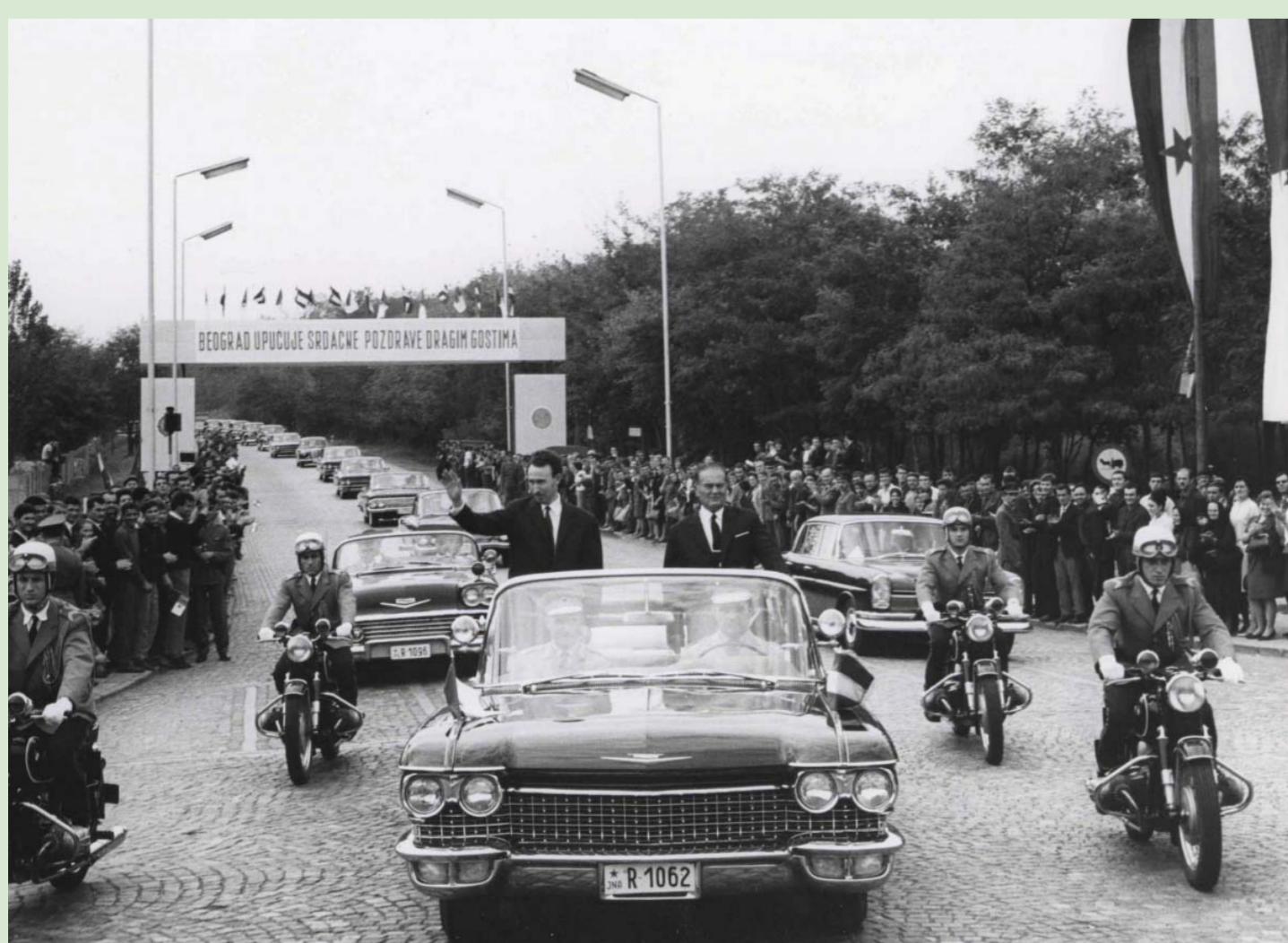
39. Дочек председника Народне Демократске Републике Алжир Хуари Бумедијена у Београду, 6. октобар 1966.

Фотографија, К 314/3, 3Ф МЈ Photo, К 314/3, ЗФ МЈ