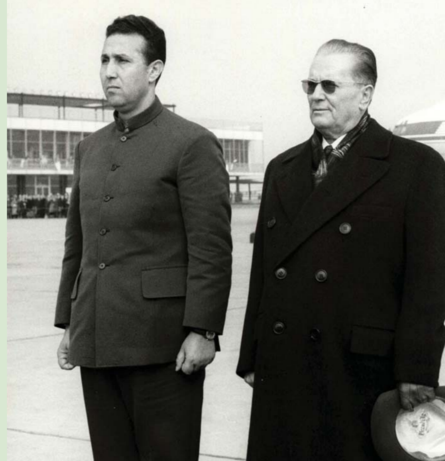
34. Председник Народне Демократске Републике Алжир Ахмед Бен Бела и председник СФРЈ Јосип Броз Тито, Београд, 5. март 1964.

Фотографија, К 117/90, 3Ф МЈ Photo, К 117/90, ЗФ МЈ