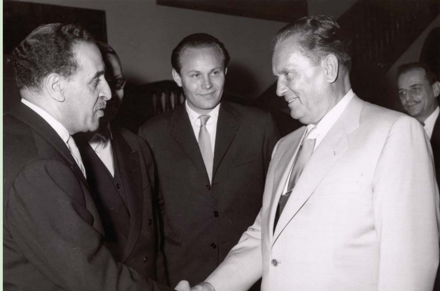
33. Председник Привремене алжирске владе Ферхат Абас и председник ФНРЈ Јосип Броз Тито, Београд, 9. јун 1959.

До прве посете високих званиčnika из Алжира дошло је јуна 1958. када је председник Привремене алжирске владе Ферхат Абас посетио Југославију. Уследило је шест посета председника Републике Алжира (једна Ахмеда Бен Беле и пет Хуари Бумедијена), три посете председника Народне скупштине Алжира и две посете министара иностраних послова. Председник Југославије боравио је у Алжиру четири пута. Осим тога шефови две државе сусрели су се и разговарали на заседањима Конференција неврстаних земаља у Београду 1961, Каиру 1964, Лусаки 1970, Алжиру 1973, Коломбу 1976. и Хавани 1979.