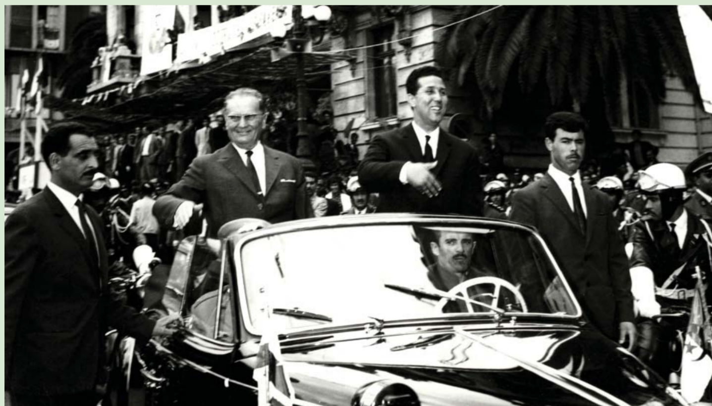
36. Председници Јосип Броз Тито и Ахмед Бен Бела у пролазу кроз град Оран, 19. април 1965.

Фотографија, К 266/82, 3Ф МЈ Photo, К 266/82, ЗФ МЈ