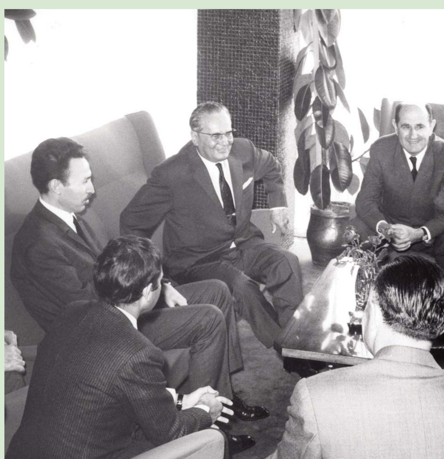
40. Председници Јосип Броз Тито и Хуари Бумедијен са сарадницима током разговора на београдском аеродрому, 12. јун 1967.

Presidents Josip Broz Tito and Mr. Houari Boumediene with members of their delegations during the talks at the Belgrade airport, June 12 th , 1967.