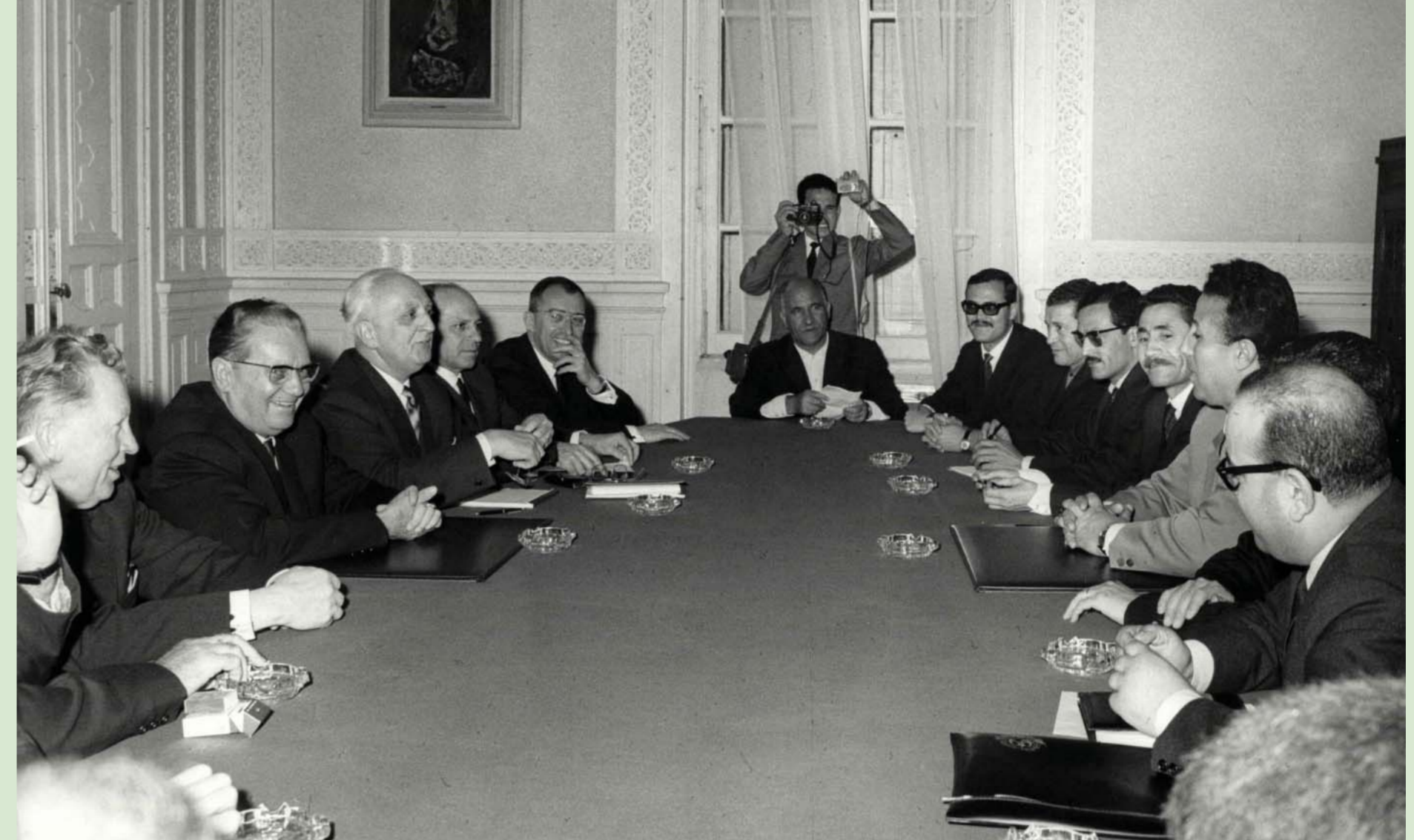
35. Председници Јосип Броз Тито и Ахмед Бен Бела са сарадницима током разговора у Константину, 18. април 1965.

Фотографија, К 238/5, 3Ф МЈ Photo, К 238/5, ЗФ МЈ