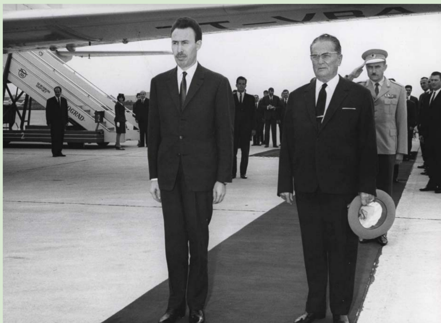
38. Председник Народне Демократске Републике Алжир Хуари Бумедијен и председник СФРЈ Јосип Броз Тито у Београду, 6. октобар 1966.

Фотографија, К 266/172, 3Ф МЈ Photo, К 266/172, ЗФ МЈ