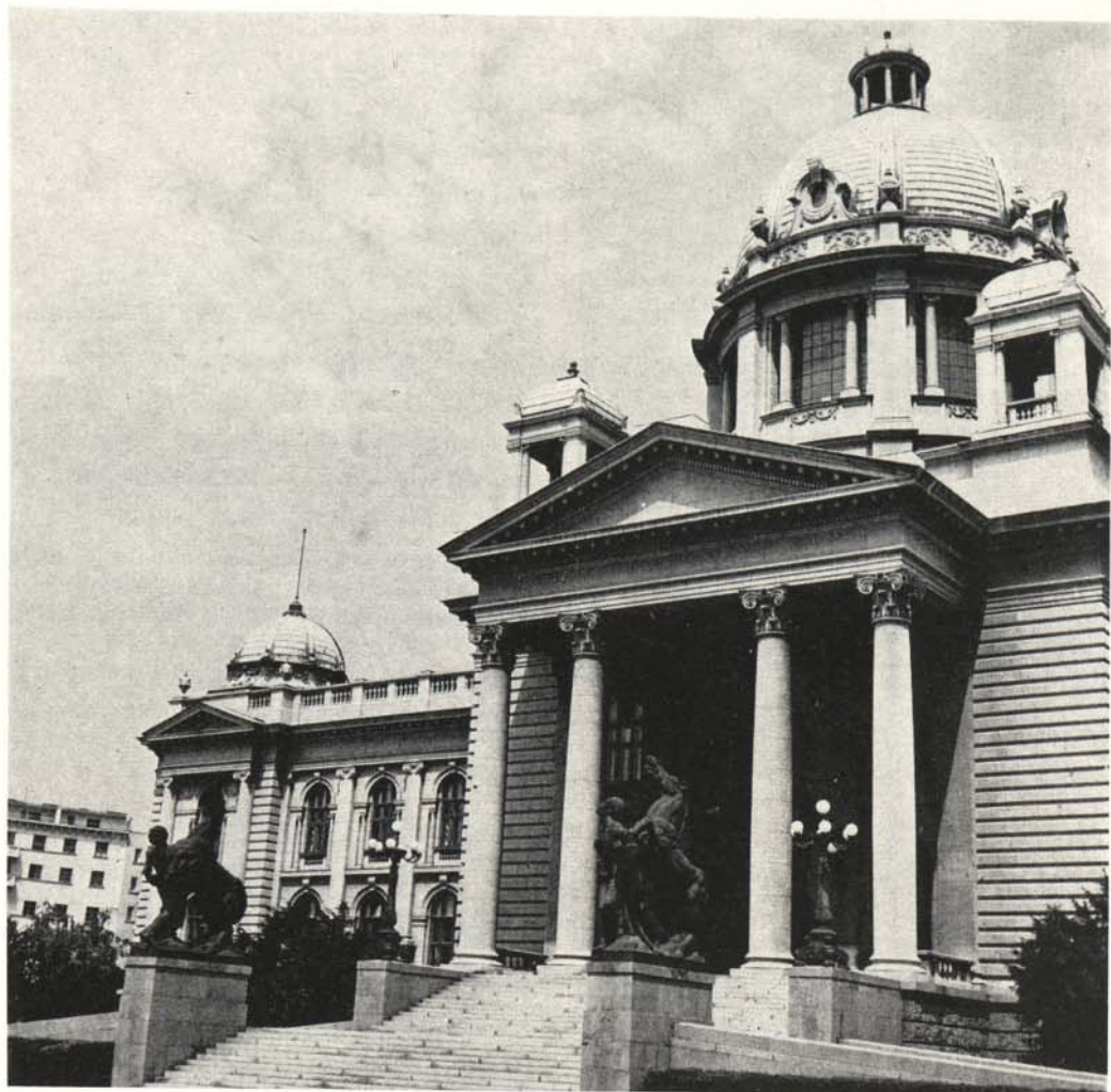
168. Skupština SFRJ