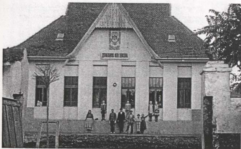
Фотографија Државне народне школе у Риђици, срез сомборски