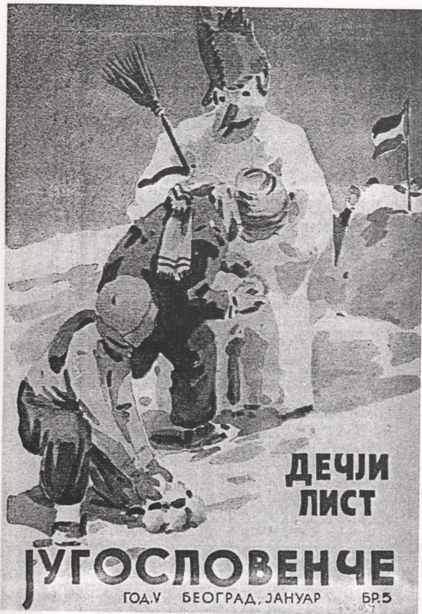
Југословенче бр. 5, Београд, јануар 1936.