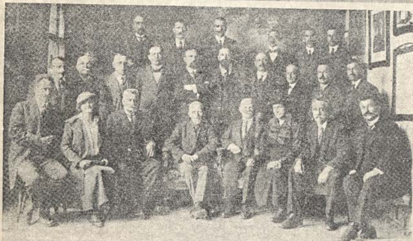
Први Главни Одбор Удружења Југословенског Учитељства у Београду, године 1920-21.

Архив Југославије, 22. јануар – 22. фебруар 2001